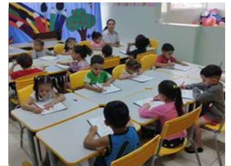
Atividade em turma – convivendo em grupo

Sede: ALAMEDA DA CRIANÇA, 105 VILA VITÓRIA – (19) 3875-4598