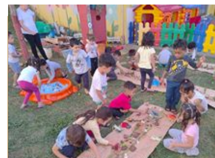
Explorando espaços com animais em miniatura.