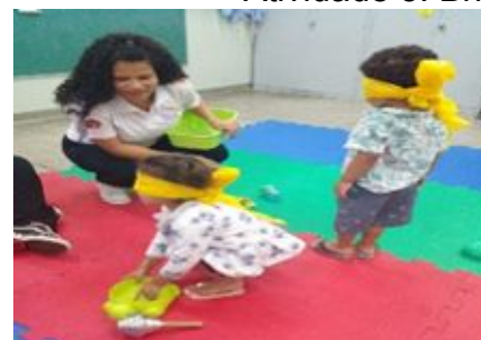
Brincadeira – Advinha o brinquedo.