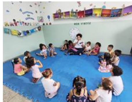
Roda de Conversa – Tema “Minha Casa”.