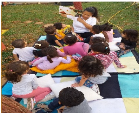
Leitura – Conviver em grupo