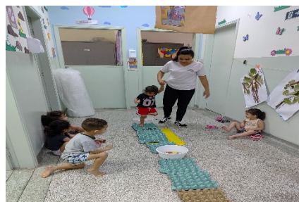
Explorando textura diversas com os Pés.