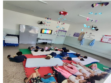
Cinema em grupo