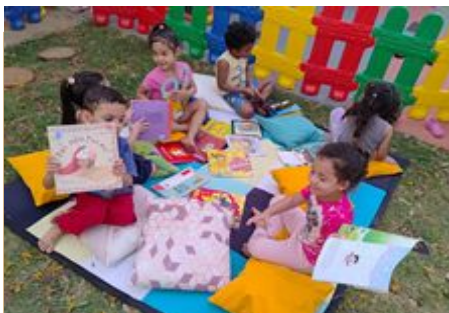
Participando de Leitura ao ar livre