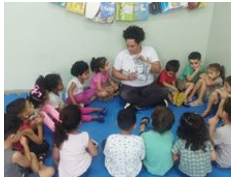
Leitura - Identidade