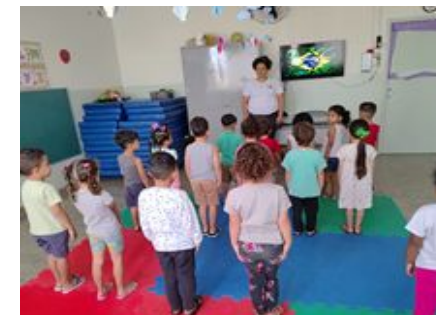
Hora Cívica – Hino Nacional