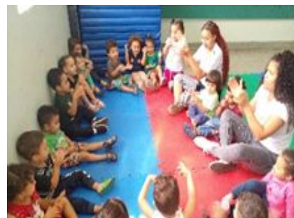
Acolhimento com musica – Expressando musicalmente