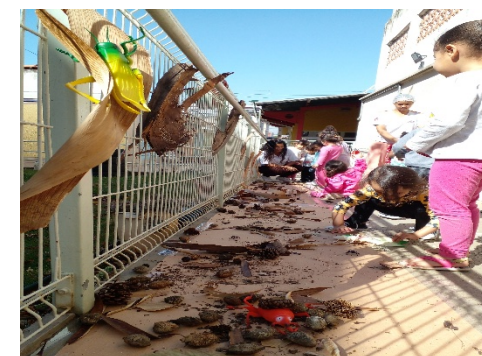
Explorando animais de jardim.