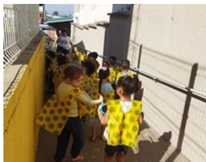
Marchinha 7 de setembro