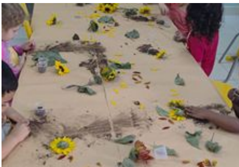
Início da Primavera (Explorando Flores de girassóis)