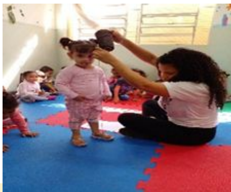
Qual é a minha altura – medindo as crianças.