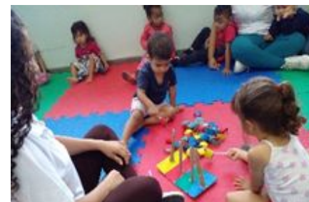
Brincadeira – Pegando argolas com canudos