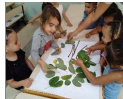
Dia da Árvore – Participando da confecção de árvore.