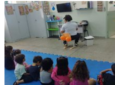
Higiene – Uso do banheiro