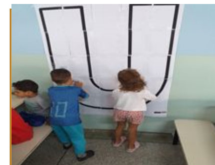
Vogal U – Participar da pintura da Vogal U