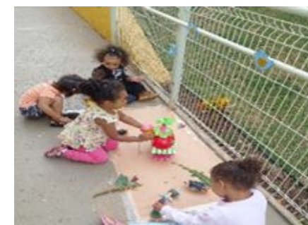
Brincadeira – Cantinho dos Pássaros.

Sede: – ALAMEDA DA CRINÇA, 105 – VILA VITÓRIA (19) 3875-4598