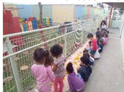
Quintal preparado: Cantinhos organizados para participação livre das crianças.