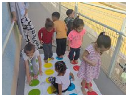
Brincando de Twister Explorando formas deslocando e reconhecendo as cores